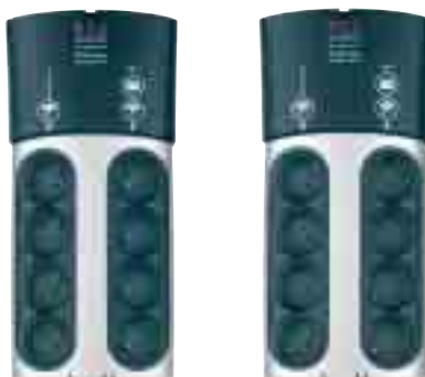
8 prises standard FR ou DIN