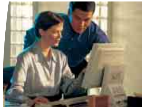
Branchez, c'est protégé !